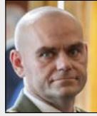
brig. gen. Miroslav FEIX

Velitel, Velitelství kybernetických sil a informační podpory, Armáda České republiky